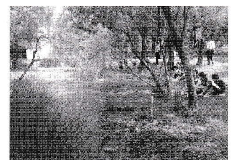
ビオトープでのスケッチ

美術館での鑑賞の楽しさを味わう経験を積ませたい。本物を鑑賞することが発想や構想に与える効果を認識し、美術館での鑑賞を推進していきたい。